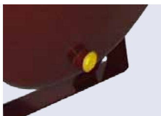
2 stk. 2" muffer i hver ende-bund (horisontale tanke)