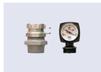
Aflåselig 2" påfyldning. Oliestandsmåler med liter-skala.